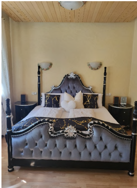
Mein Bett in der Hochzeitssuite // Sprudelbad