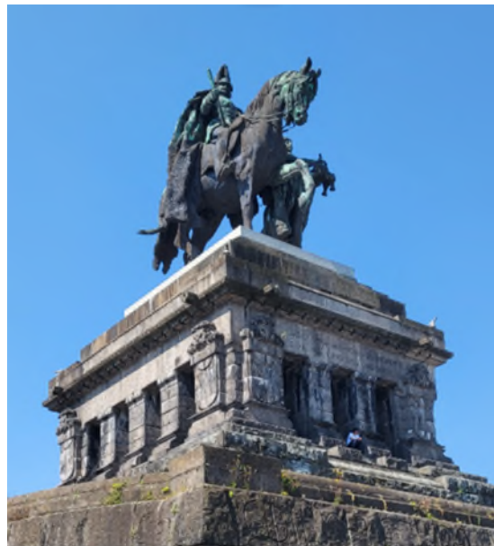
Kaiser Wilhelm hoch zu Ross