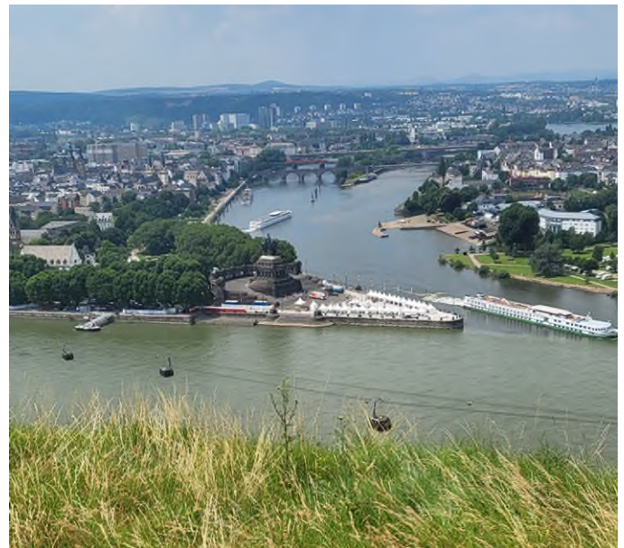
Deutsches Eck Zusammenfluss Rhein und Mosel

Wir gehen zurück zur Seilbahnstation und fahren mit der Gondel hoch zur Festung Ehrenbreitstein. Dort verbringen wir ein paar interessante Stunden auf dem Rundgang durch Raum und Zeit.