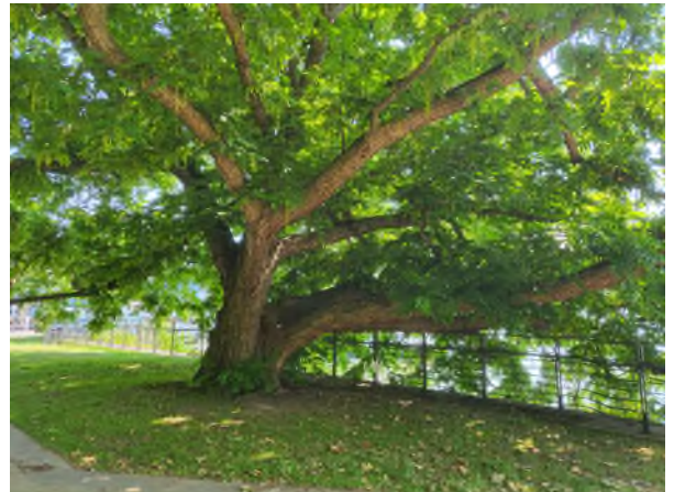
Wunderschöne alte Esche