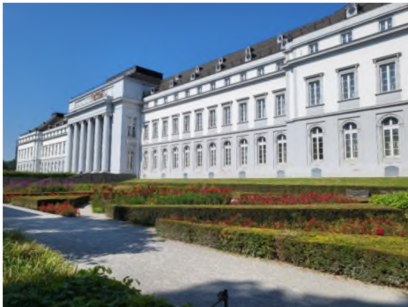
Kurfürstliches Schloss Koblenz

Heute ist Kaiser Wilhelm und die Festung Ehrenbreitstein angesagt. Der Kaiser, bzw. die Bronzestatue beeindruckt durch ihre phänomenale Grösse. Der Kaiser Wilhelm, hoch zu Ross blickt über den Zusammenfluss von Rhein und Mosel, Richtung Bonn Rheinabwärts.